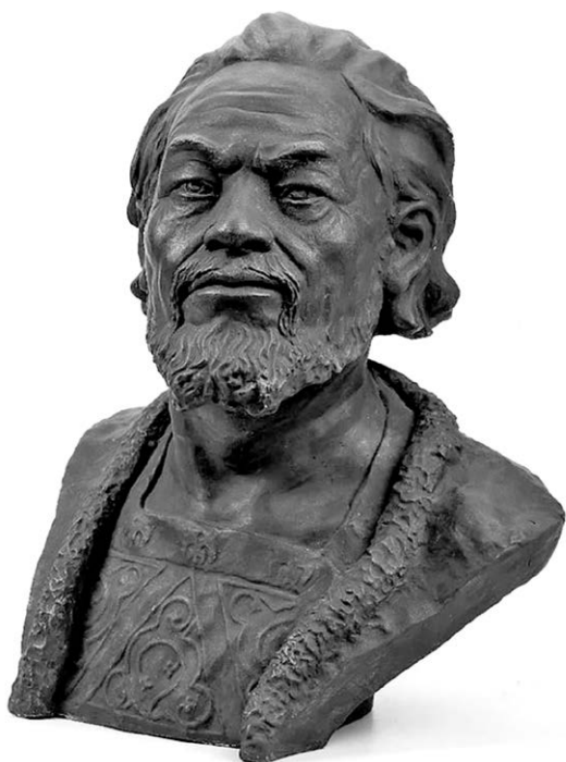
Андрій Боголюбський. Реконструкція за черепом

Так було завжди, просто інтенсивність і методи варіювалися залежно від кровожерності того чи іншого кремлівського ватажка. Але загалом і знищення Січі царем Петром, і заборона козацтва Катериною чи української мови Олександром, і навіть брежневська русифікація — то все щаблі повзкого, невпинного геноциду. Бо без деукраїнізації України, про яку