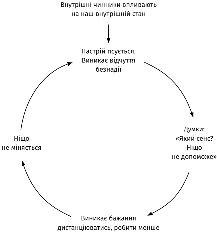
Рисунок 1: Низхідна спіраль поганого настрою. Як кілька днів кепського настрою можуть перерости в депресію. Розірвати це коло легше, якщо вчасно виявити процес і вжити заходів.

Ми легко втрапляємо в цю пастку, бо різні аспекти нашого існування впливають один на одного. Однак із цього глухого кута є вихід.