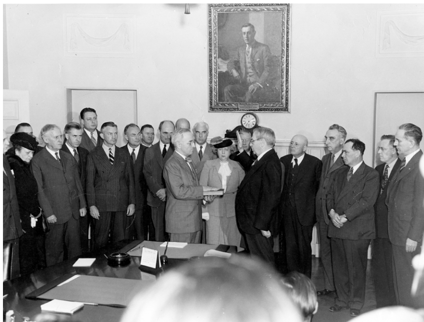
Гаррі Трумен складає присягу президента. 12 квітня 1945 року

руйнівної сили». Цей проєкт такий засекречений (і такий потенційно небезпечний), що про нього знає лише купка людей. Військовий міністр пообіцяв докладно доповісти про все Труменові за кілька днів, коли той облаштується на новому місці.