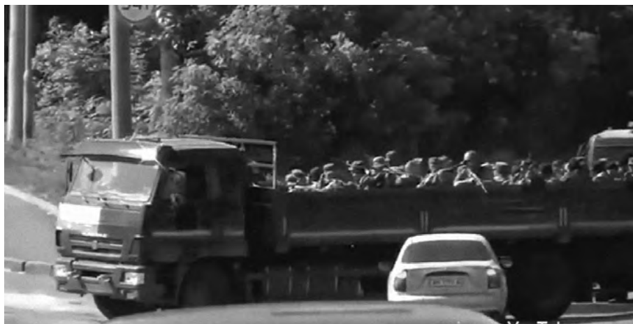
Вантажівка з проросійськими бойовиками біля аеропорту Донецька. Кадр з фільму «Ніхто, крім нас»

Ми перебували в сріблястому ангарі. Дії сепаратистів були, скажемо так, хаотичні. Вони пробували наступати зі стрілецькою зброєю, але після першого авіаудару в них почалася паніка. Бойовий дух підупав, бо зрозуміли, що немає сенсу автоматами воювати проти літака. До того ж після першого удару ніхто не знав, чи буде другий. Ми ж тримали позиції, вели вогонь — виконували свою роботу. Бій тривав дві доби.