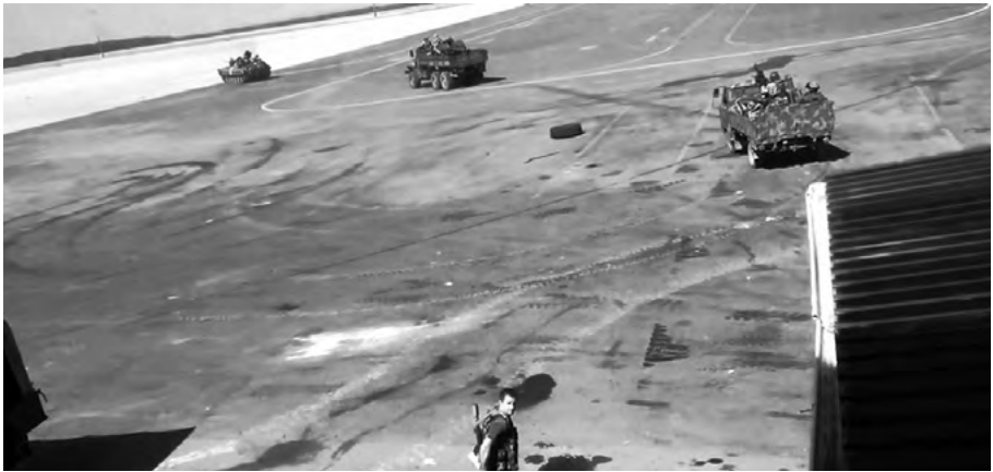
Колона 3-го полку спеціального призначення ЗСУ виходить на допомогу «Дніпро-1», 14 вересня 2014 року. Кадр з фільму «Ніхто, крім нас»

Пам'ятаю, тоді було приблизно пів на першу дня. Ми сіли поїсти, хтось займався своїми справами, хтось пив каву. Раптом зайшов наш командир і каже: «Одягаємось, батальйон «Дніпро-1» потрапив у засідку недалеко від аеропорту, потрібна допомога». Ми висунулись колоною: БМП, «Урал», ЗУ (зенітна установка. — Ред.) і «таблетка» («вазик»). Та до «Дніпра» ми не доїхали, бо терористи влаштували нам засідку за злітною смугою, у відкритому полі.