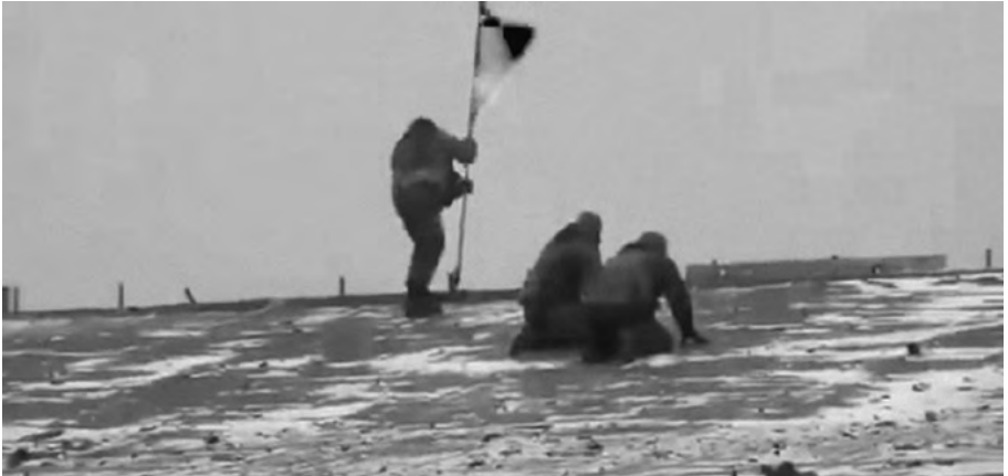
Кадр з відео «Киборги внонь водрузили прапор України над Донецьким аеропортом». Опубліковано 10 грудня 2014 року

Нам дуже пощастило, що ми підняли його і змогли нормально спуститися. Бо за п'ять хвилин сепаратисти вже почали його обстрілювати. Я не витримую, бігом спускаюся донизу, кричу, що стріляють по прапору: мовляв, давайте відстрілюватися!