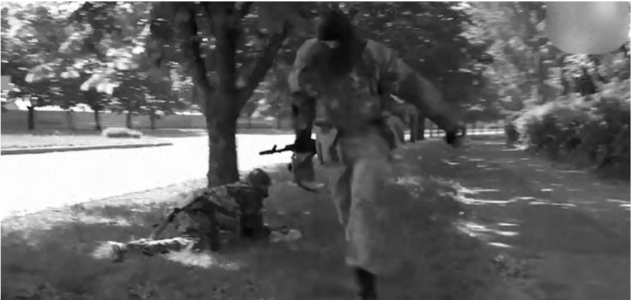
Сепаратисти беруть участь у штурмі ДАП 26 травня 2014 року. Кадр з фільму «Ніхто, крім нас»

Дуже добре спрацювали водії з нашого полку. Вони врятували багато техніки. Вона стояла не по-бойовому, а рядочком, одна машина за одною в зоні досяжності стрілецької зброї сепаратистів. Хлопці вдвох сідають у машину, їдуть, далі один вискакує, сідає за іншу. Одну ставлять — наступну беруть, і так вони ходка за ходкою під вогнем перегнали всю техніку. Як казали: чи зухвали, чи відчайдушні.