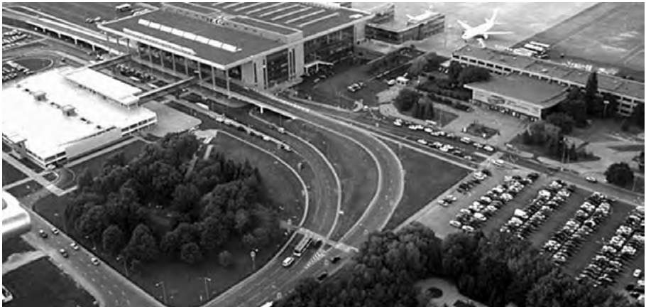
Новий (ліворуч) і старий (праворуч, біля літака) термінали ДАП

Аеропорт — це завжди стратегічний об'єкт. Він у першу чергу має братися під охорону. У будь-якому випадку, при будь-якій тактиці. Ті, хто атакує, завжди спочатку намагаються захоплювати аеропорти, щоб можна було садити авіацію. А вже був Крим, вже марширувала «Русская весна» на Сході.