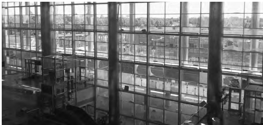
Новий термінал. Перші обстріли