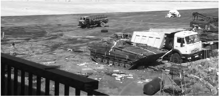
Знищена техніка перед терміналами ДАП. Кадр з фільму «Ніхто, крім нас»

Коли ми вперше йшли, то взагалі не уявляли, як воно там. Ідеш, купа заліза валяється довкола, скло, згорілі БТР наших хлопців, які були тут. Проходиш повз них, а в голові одна думка: «Тільки б додому повернутися». Такі думки були. Перший раз було дуже страшно.