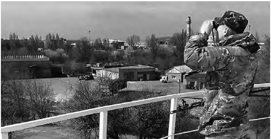
Український боєць оглядає у бінокль околиці аеропорту. Кадр з фільму «Ніхто, крім нас»

Наступного дня ми розділилися: половина перебувала на постах, половина відпочивала. Я був на посту. До нас під'їхали і сказали: «У нас гості». Ніхто з нас