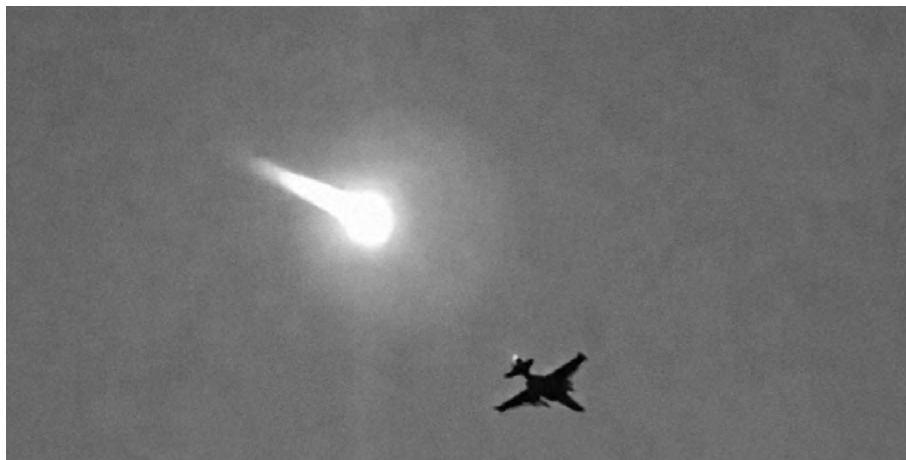
Український Су-24 наносить авіаудар по позиціях сепаратистів біля аеропорту. Кадр з фільму «Ніхто, крім нас»

Ми перебували в сріблястому ангарі. Дії сепаратистів були, скажемо так, хаотичні. Вони пробували наступати зі стрілецькою зброєю, але після першого авіаудару в них почалася паніка. Бойовий дух підупав, бо зрозуміли, що немає сенсу автоматами воювати проти літака. До того ж після першого удару ніхто не знав, чи буде другий. Ми ж тримали позиції, вели вогонь — виконували свою роботу. Бій тривав дві доби.